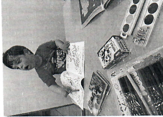
Помощь канцтоварами для развития мелкой моторики