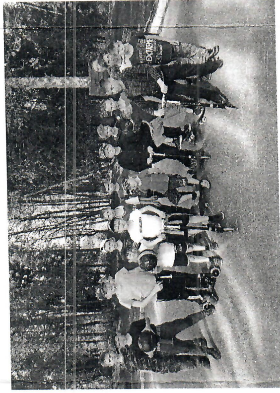
Воспитанники школы-интерната с пасхальными подарками (Ивановская обл.)